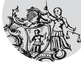
Abbildung: Ein Grenadier, Detail Stuckatur Gemeindehaus Trogen, um 1770

Festbetrieb auf dem Platz bis 24:00. Musik und Lesungen je ca. 30 Min., freiwilliger Unkostenbeitrag. Schützenmuseum, Gemeinde Trogen und Kantonsbibliothek im Rahmen von www.jahrhundertderzellweger.ch in Kooperation mit der Rab-Bar und der Kronengesellschaft Trogen. Mit Unterstützung der Stiftung SK Trogen 1821 und der Rudolf & Gertrud Bünzli-Scherrer-Stiftung.